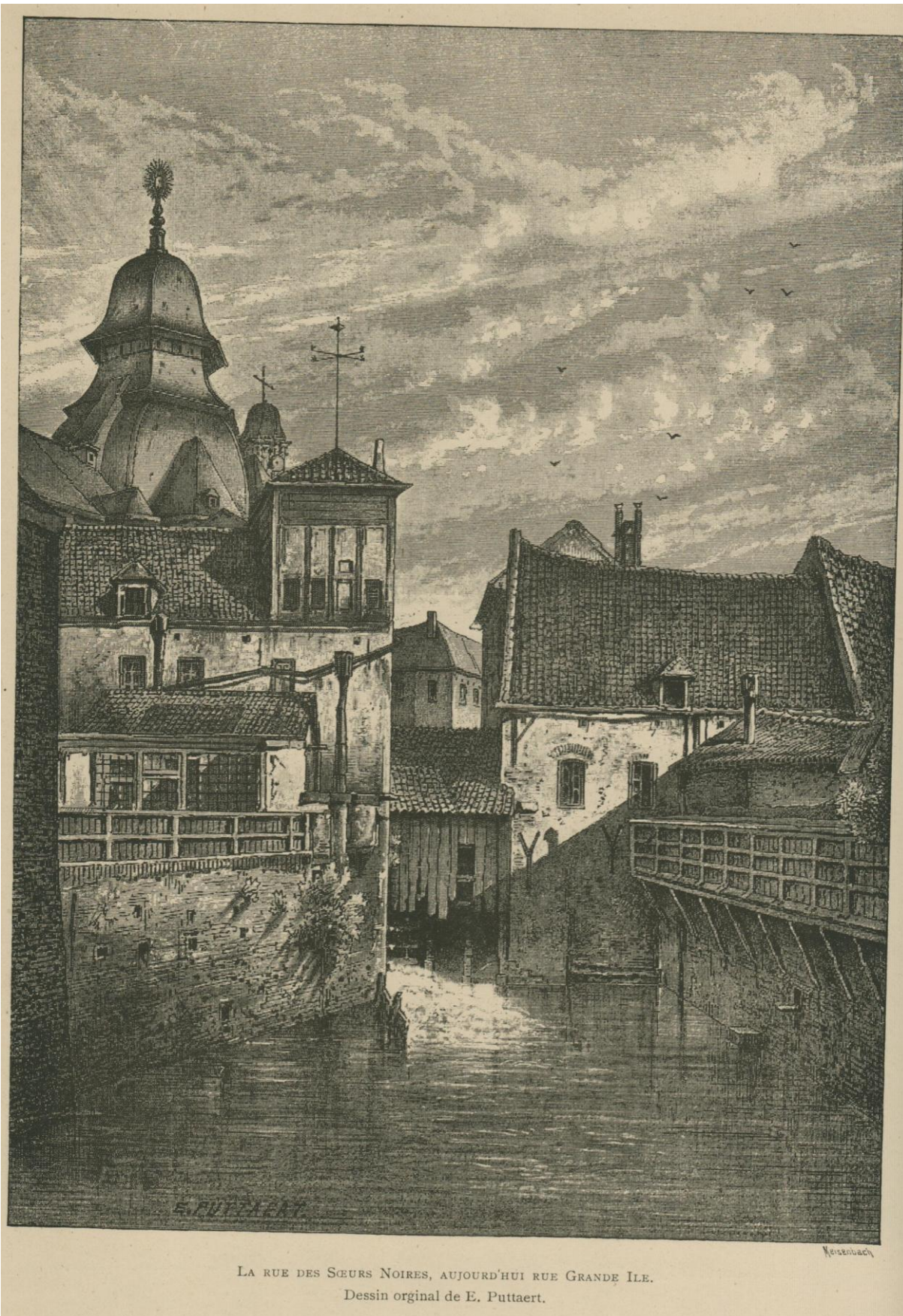
LA RUE DES SŒURS NOIRES, AUJOURD'HUI RUE GRANDE ILE. Dessin original de E. Puttaert.